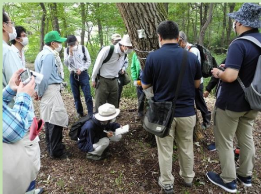
キクイムシ捕獲用トラップの説明を聞きながら観察する参加者。