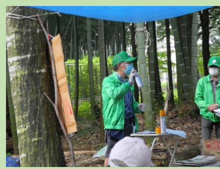
協会、代表からトラスト 13 号地のナラ枯れ調査結果・対策などを説明されました。