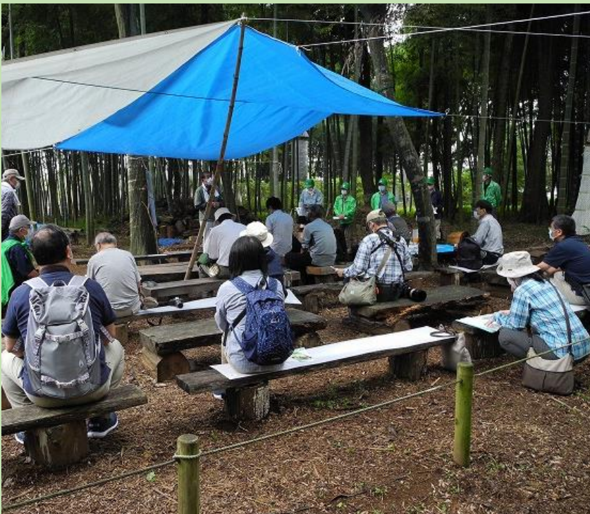
小雨模様の中ボランティアスタッフが張ったタープ下に集まった参加者

自然観察大学 (NPO)、NPO さとやま、狭山市役所、伊奈町役場、埼玉県みどり自然課、いろいろいきものネット埼玉 (NPO) の関係者が参加されました。